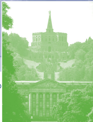
Foto Herkules

GWG der Stadt Kassel Neue Fahrt 2, 34117 Kassel www.gwg-kassel.de Service Hotline (0561) 70 00 1- 888 Gaestewohnungen@gwg-kassel.de